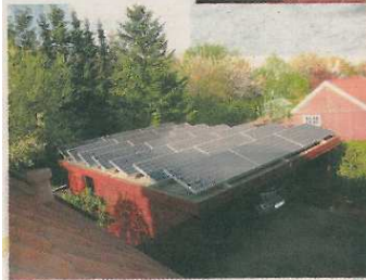
Her er hele garagens tag blevet udnyttet til solenergi.

Der blev holdt åbent hus i private hjem på 50. Interessen for den energi var langt større end ventet.